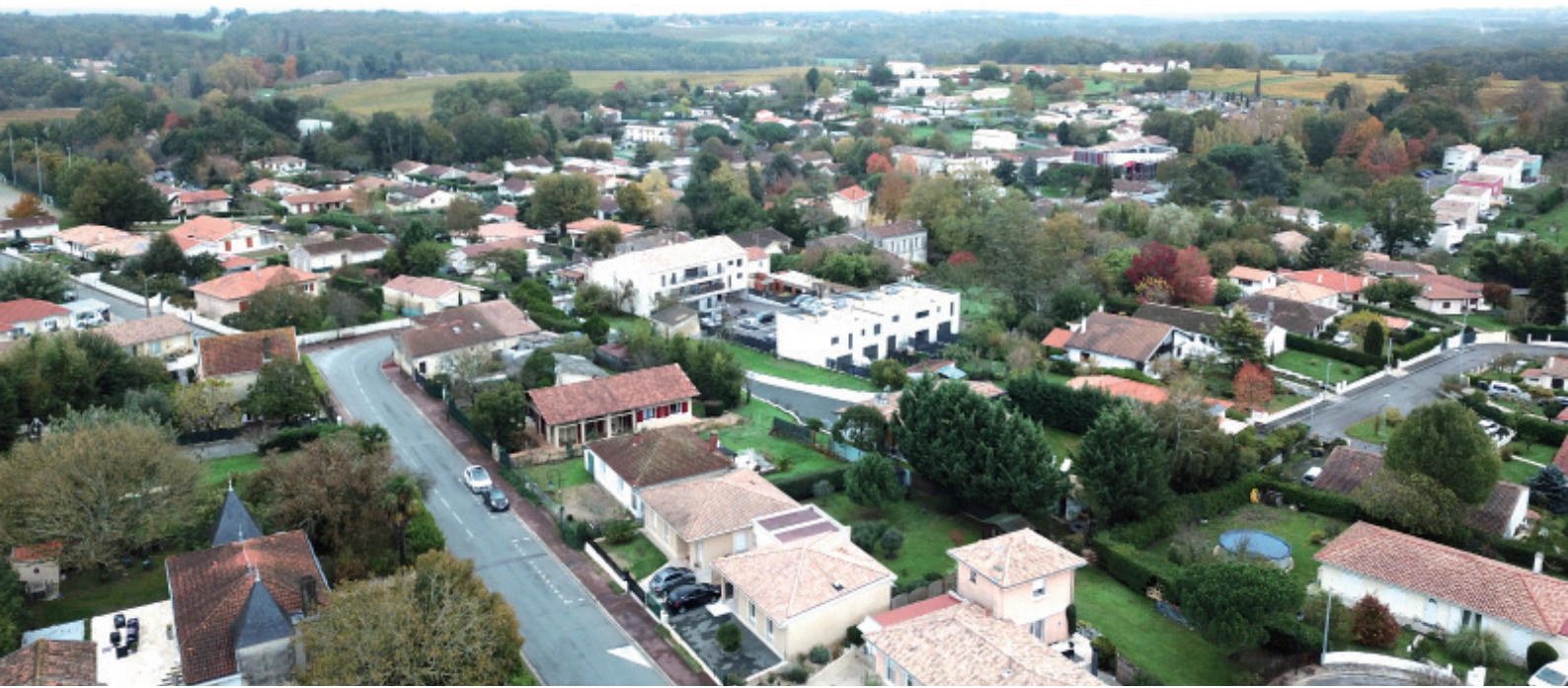
Le bourg en 2019 depuis la rue Notre Dame de Patène