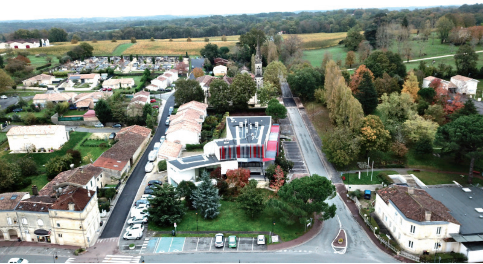
Le pôle associatif en 2019